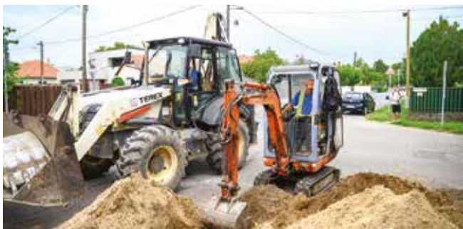
A Hun utcában indították el a víziközmű-hálózat fejlesztését

A kormány tavasszal döntött arról, hogy Debrecen víziközmű-rendszerének nagyszabású, több elemből álló fejlesztésére 109 milliárd forintot biztosít. A fejlesztések között lesznek lakossági és ipari célokat szolgáló beruházások is.