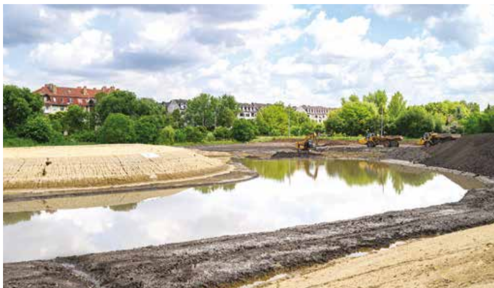
A Civaqua-Tóció-projekt részeként 1,6 hektáros tározót alakítanak ki a Vezér úton

– Ígértük, hogy az idei év végére egy üzemkész állapotban lévő első ütemet adunk át, így egy évtizedek óta, a hetvenes évek óta várt pillanat jön el, amikor, a Civaquának köszönhetően, a Keleti-főcsa-