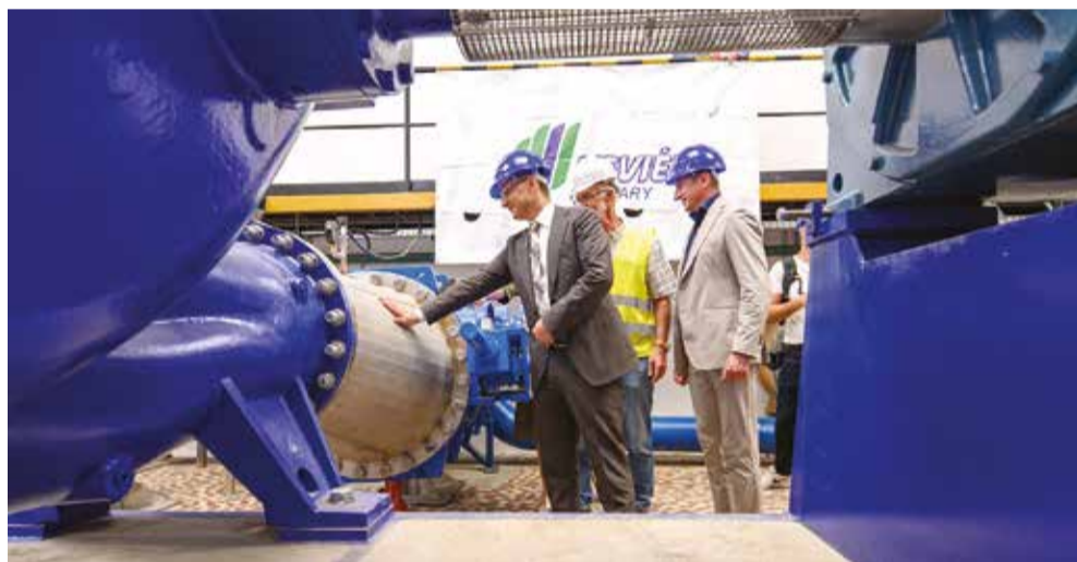
Az 1500 kilowattos motorral szerelt, hatalmas szivattyú másodpercenként 1275 liter vizet képes mozgatni

Időközben már zajlik a Civaqua-program további ütemeinek tervezése, melyek révén a Tisza vize eljut majd a Nagyerdőre és a Debrecen keleti oldalán fekvő jóléti tavakhoz is.