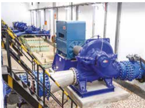
Nagyon komoly műszaki megoldásokat kell alkalmazni ahhoz, hogy a víz eljusson Debrecenbe

A Hajdúhátsági Többcélú Vízgazdálkodási Rendszer Balmazújváros melletti szivattyútelepén megkezdődött annak a nagy teljesítményű szivattyúnak a tesztüzeme, mely központi szerepet játszik a Civaqua-