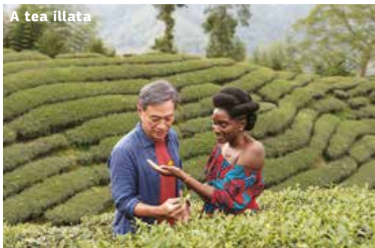
A tea illata