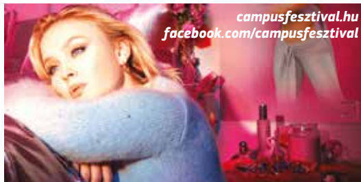
A svéd Zara Larsson is fellép a Campuson

campusfesztival.hu facebook.com/campusfesztival