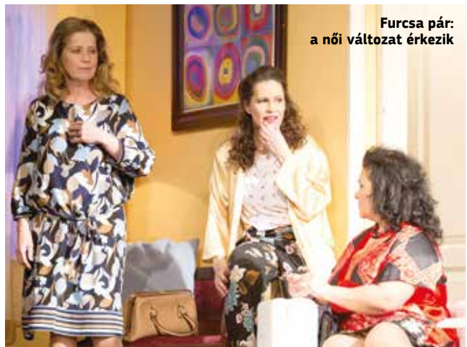
Furcsa pár: a női változat érkezik

A Nagyerdei Szabadtéri Játékokra jegyek a Csokonai Színház jegypénztárában (Víg Kamaraszínház, Bajcsy-Zsilinszky u. 1–3., volt Víg Mozi) és a www.jegy.csokonaiszinhaz.hu oldalon vásárolhatók. A Debreceni Ünnepi Játékok produkcióira az Interticket jegyirodákbán, online a debreceniunnepijatekok.hu és a jegy.hu oldalon lehet jegyet vásárolni. Bővebb információ: www.debreceniszabadtteri.hu/programjaink/ ; debreceniunnepijatekok.hu