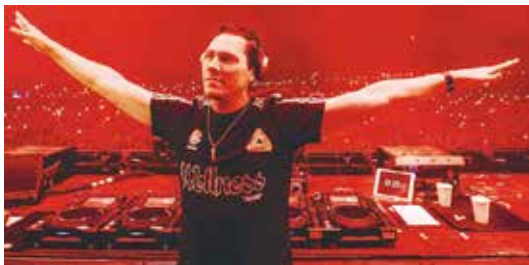
Debrecenbe készül a holland sztár DJ, Tiësto

A részletes napi programbontás elérhető a fesztivál honlapján és közösségi média oldalain.