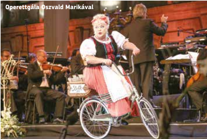
Operettgála Oszvald Marikával

Telt házas előadásokkal játszanak a társulatok a Nagyerdei Szabadtéri Játékokon. A programok – a második alkalommal megrendezett Debreceni Ünnepi Játékok eseményeivel együtt – egész nyárra kínálnak önfelelt szórakozást a debrecenieknek és az ide látogató turistáknak. A műfajok között klasszikus és kortárs darabok, vígjátékok, musical, koncert és táncjáték szerepelnek az észak-alföldi régió legnagyobb szabadtéri színpadán.